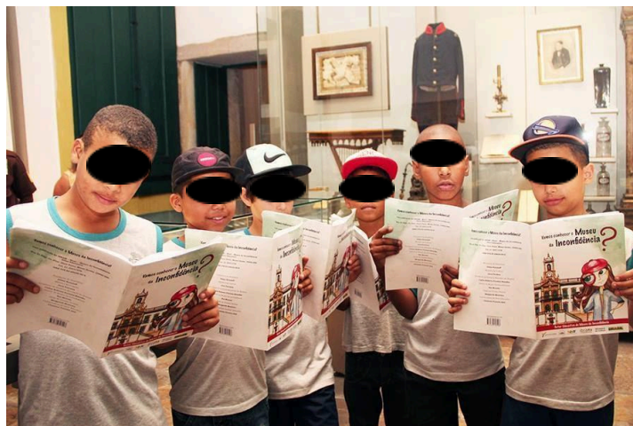
Figura 14 - Visita mediada com o livro Vamos conhecer o Museu da Inconfidência - 2016