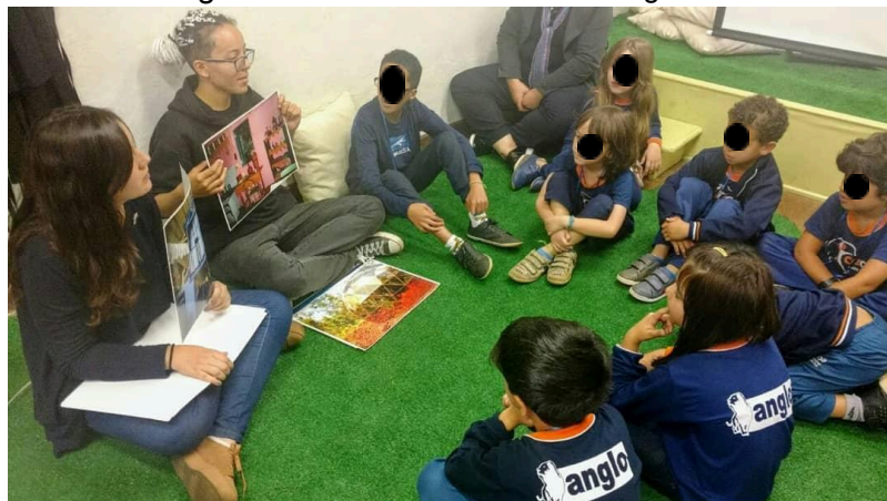
Figura 7 - Oficina - Meu museu imaginário