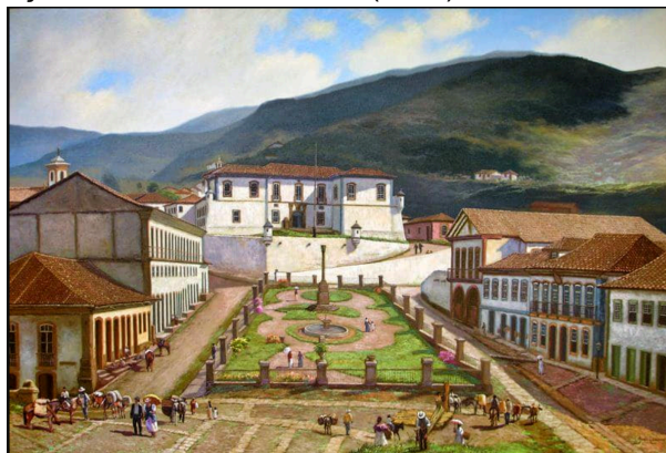
Figura 3 - Praça Tiradentes, Ouro Preto (1885), tela de José Rosário.