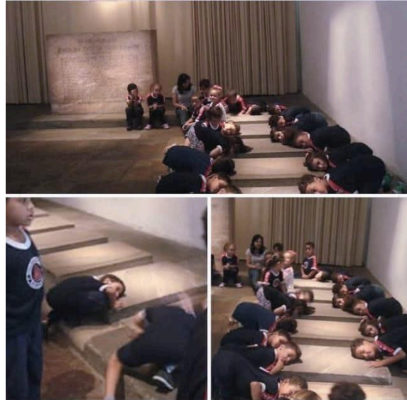
Figura 1 - Visita mediada realizada pelo Setor Educativo do Museu da Inconfidência.