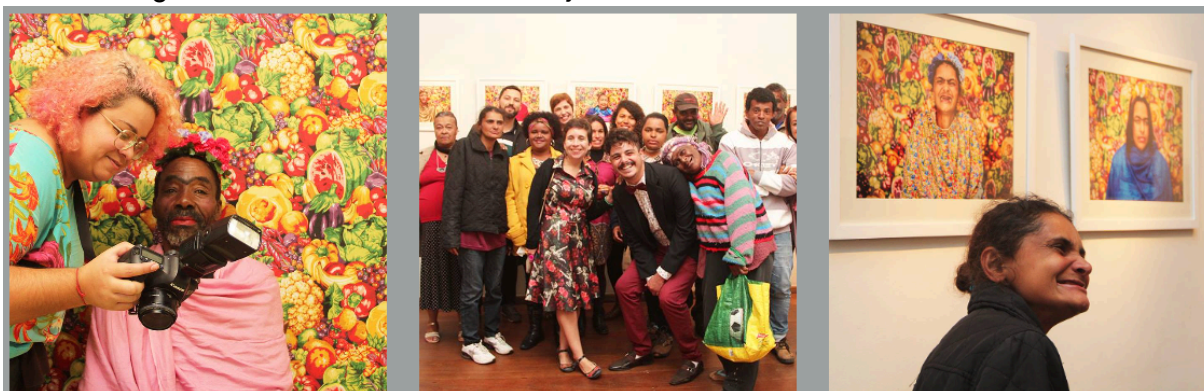
Figura 17 - Oficina do Ciclo II do Projeto Girassol Todos Podem ser Frida - 2016

Fonte: https://educativomdinc.wordpress.com/2020/07/30/projeto-girassol/