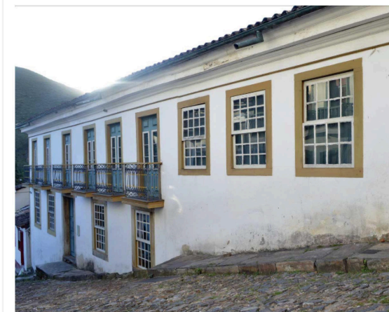
Figura 5 - Casa do Pilar