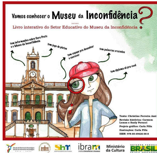
Figura 15 - Capa do Livro "Vamos Conhecer o Museu da Inconfidência"