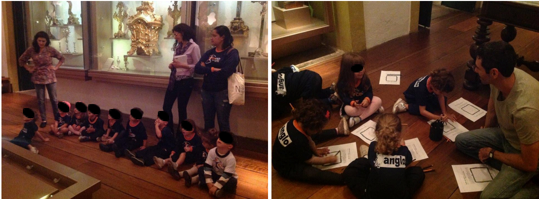
Figura 13 - Visita Mediada sobre o Barroco - colégio CEOP 2018