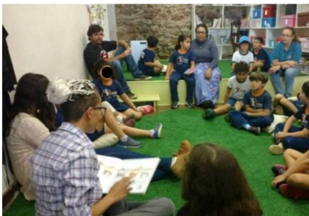
Figura 8 - Leitura do livro na oficina "Meu Lugar na História"

A oficina era desenvolvida em dois momentos principais. No primeiro, o foco recaía sobre o sujeito como agente histórico; no segundo, buscava-se relacionar esse sujeito ao espaço em que vive, com ênfase em Ouro Preto. No momento inicial, era apresentado às crianças um material introdutório, que poderia ser um vídeo ou a leitura de um livro, a depender da faixa etária do grupo, com o objetivo de sensibilizá-las para o tema, como podemos observar na imagem 8, onde é feita a leitura do livro para uma turma de aproximadamente 8 anos. Embora eu não me recorde com precisão de todos os vídeos utilizados, lembro-me de um livro que se tornava especialmente significativo para os participantes, intitulado Guilherme Augusto Araújo Fernandes 13 .