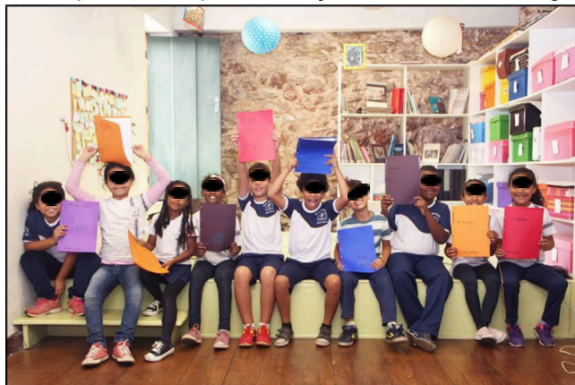
Figura 10 - Livros produzidos pelas crianças na oficina "Meu lugar na História"