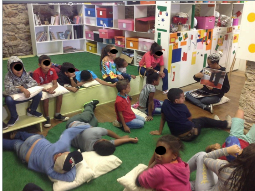
Figura 6 - Oficina Meu Museu Imaginário