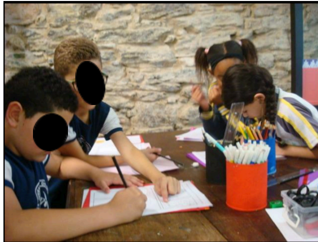
Figura 11 - Montagem dos livros na oficina "Meu lugar na história"