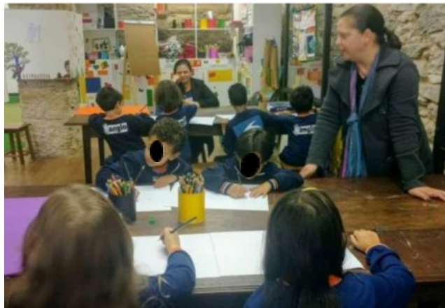
Figura 9 - Momento de montagem dos livros na Oficina "Meu lugar na História"

Essa narrativa servia como um importante ponto de partida para dialogar com as crianças sobre a relação entre objetos, memória e história, estabelecendo conexões diretas com o acervo museológico. O diálogo que se seguia à leitura era conduzido de acordo com a idade dos alunos, sempre de forma aberta, incentivando a participação e a inserção de experiências pessoais no debate. Em um segundo momento da oficina, convidávamos as crianças a contar uma história ou compartilhar uma memória significativa por meio da criação de um pequeno livro em quadrinhos, como podemos observar na Imagem 9. Esse material era previamente preparado antes da chegada do grupo, continha uma capa e, em seu interior, uma página com quadros em branco, permitindo que as crianças organizassem suas narrativas de forma cronológica como vemos nas imagens 10 e 11.