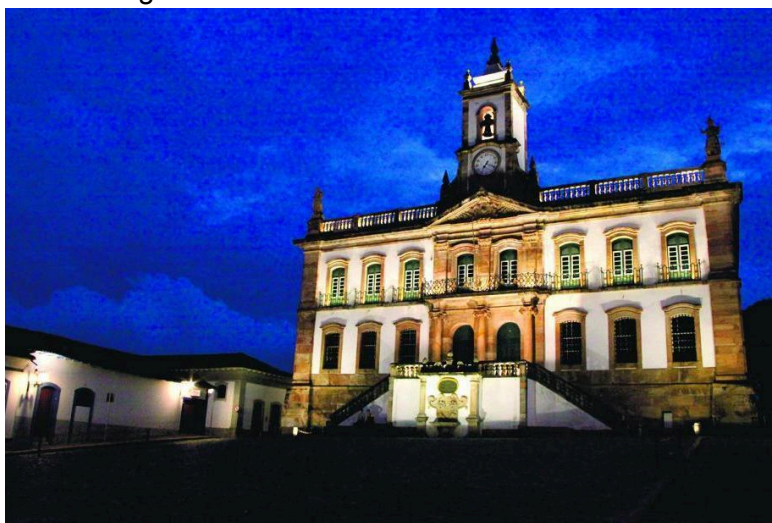
Figura 4 - Fachada do Museu da Inconfidência