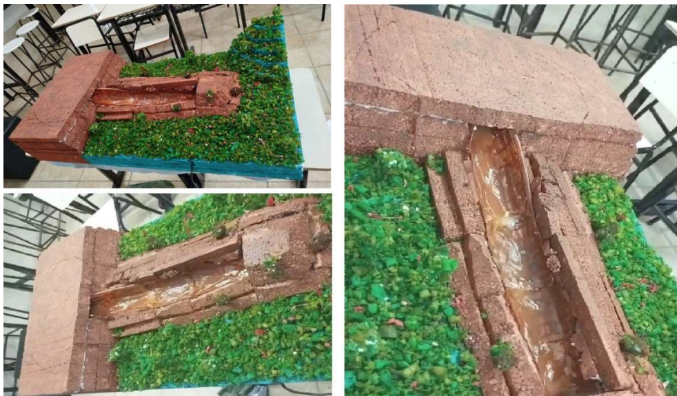
Imagem 02: Maquete N° 02 (barragem à montante após desmoronamento)