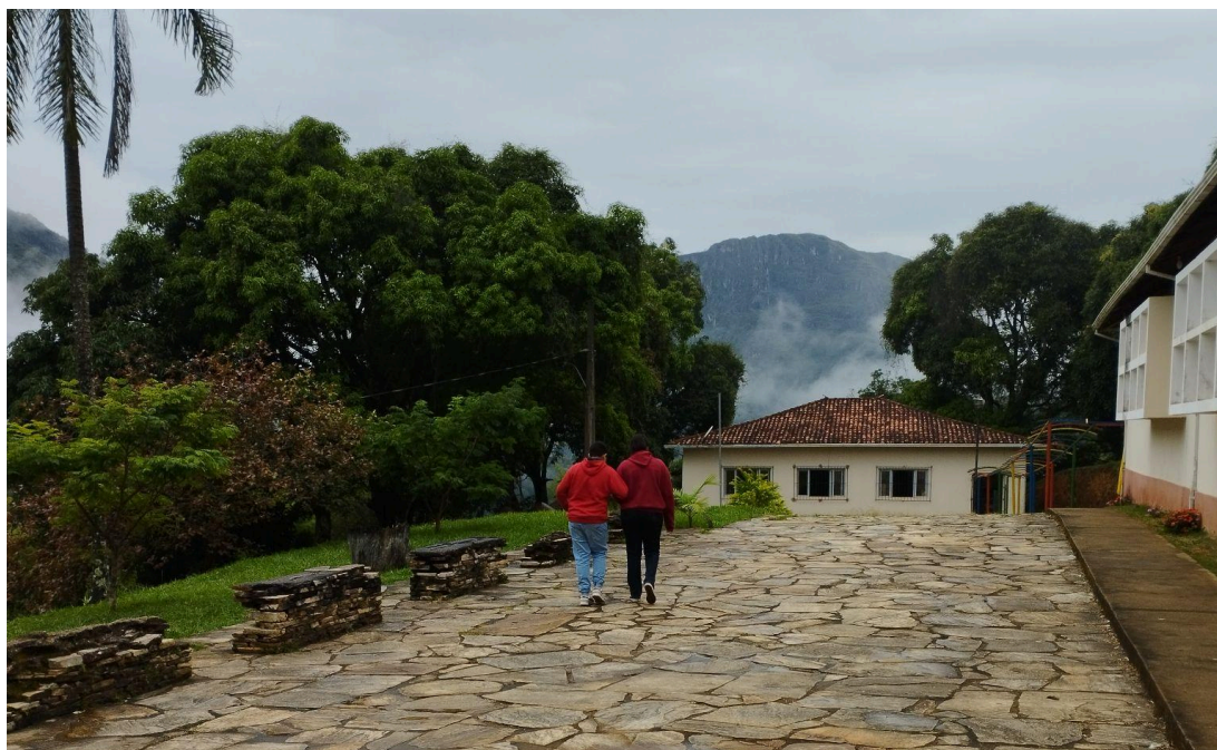
Figura 3 - Pátio da Escola Municipal Aleijadinho