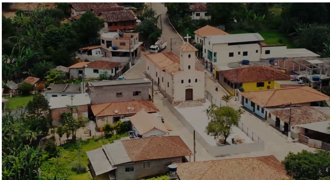
Figura 2 - Vista aérea do centro urbano do distrito de Santo Antônio do Salto.