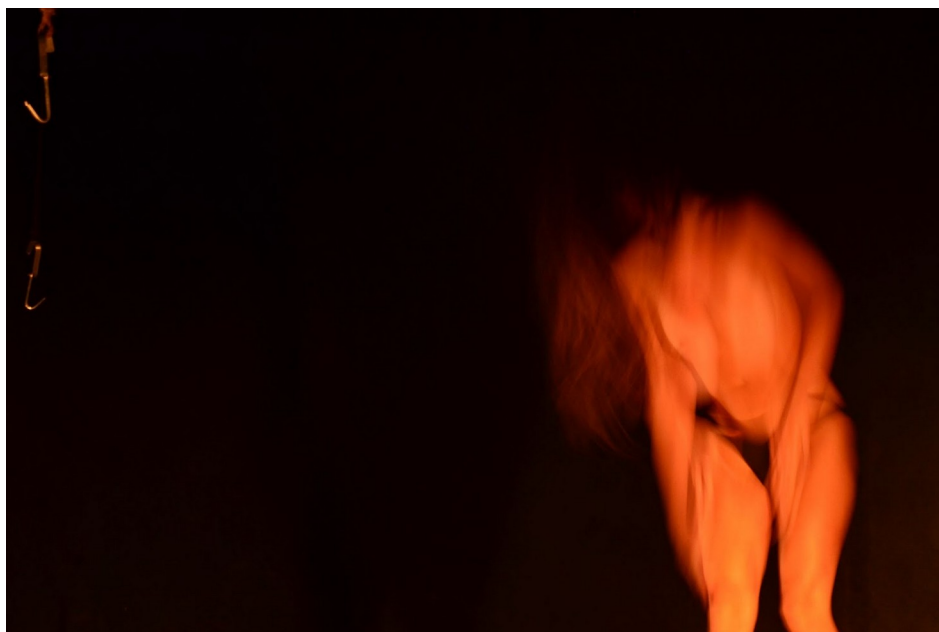
Figura 4 – Acervo pessoal. Foto de Gustavo Maia.