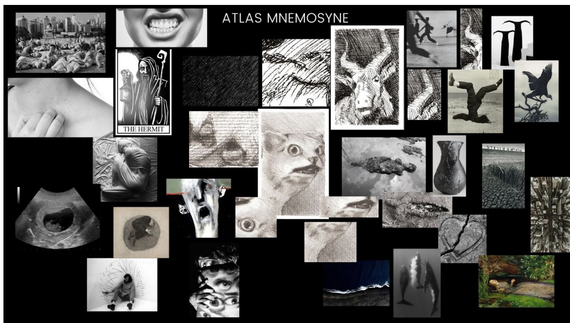
Figura1 – Mapa desenvolvido pela autora. Arquivo pessoal (2023).

Na segunda etapa do processo de criação somos instigados por Peretta a criar partituras de movimentos, estabelecendo uma relação sincera entre essas imagens e o corpo, premissa máxima do butô . A dança butô , extremamente teatral e de origem japonesa, foi criada por Tatsumi Hijikata e Kazuo Ohno, dentre outros artistas, no final da década de 1950, como resposta à cultura do período pós-guerra no Japão e às formas tradicionais de dança. O Ankoku Butô – dança das sombras e da escuridão – consiste na dança do e desde o corpo, onde a carne assume o lugar de causa, propósito e fim, tendo como objetivo a diluição ou transcendência do corpo a partir de uma profunda investigação arqueológica da materialidade do nikutai , o “corpo de carne” (PERETTA, 2013). O butô de Hijikata buscava aniquilar a construção do shintai , o “corpo social”, compreendido como um corpo alienado e subserviente ao poder, ou seja, moldado a partir das estruturas de poder. Considero aqui, as estruturas atuais de poder que regem a sociedade e a que estamos sujeitos, além do cerceamento do corpo através de marcadores como gênero, sexualidade e racialidade.