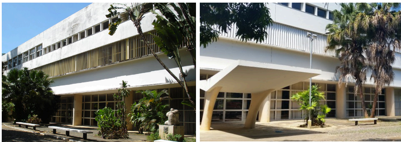
Figura 3 - Colégio Cataguases

O projeto do Colégio Cataguases (figura 3) foi finalizado em 1944, ao mesmo tempo que outros dois empreendimentos importantes para a cidade: a igreja matriz, criada por Edgar Guimarães do Valle em 1943, e a Casa de Saúde, também projetada por Oscar Niemeyer. Tanto a residência de Francisco Peixoto quanto o Colégio Cataguases seguem os mesmos princípios de desenho arquitetônico. Segundo Niemeyer, a casa "é simples, confortável e bem resolvida", enquanto o projeto da escola também traz uma solução muito simples, que não requer explicações. É um colégio com uma arquitetura correta e moderna, sendo uma obra econômica. Ambos foram idealizados a partir de um volume retangular, elevados sobre pilotis e integrados aos jardins de Burle Marx, que são embelezados por esculturas. No colégio também é contemplado com pinturas, que serão abordadas no decorrer da monografia.