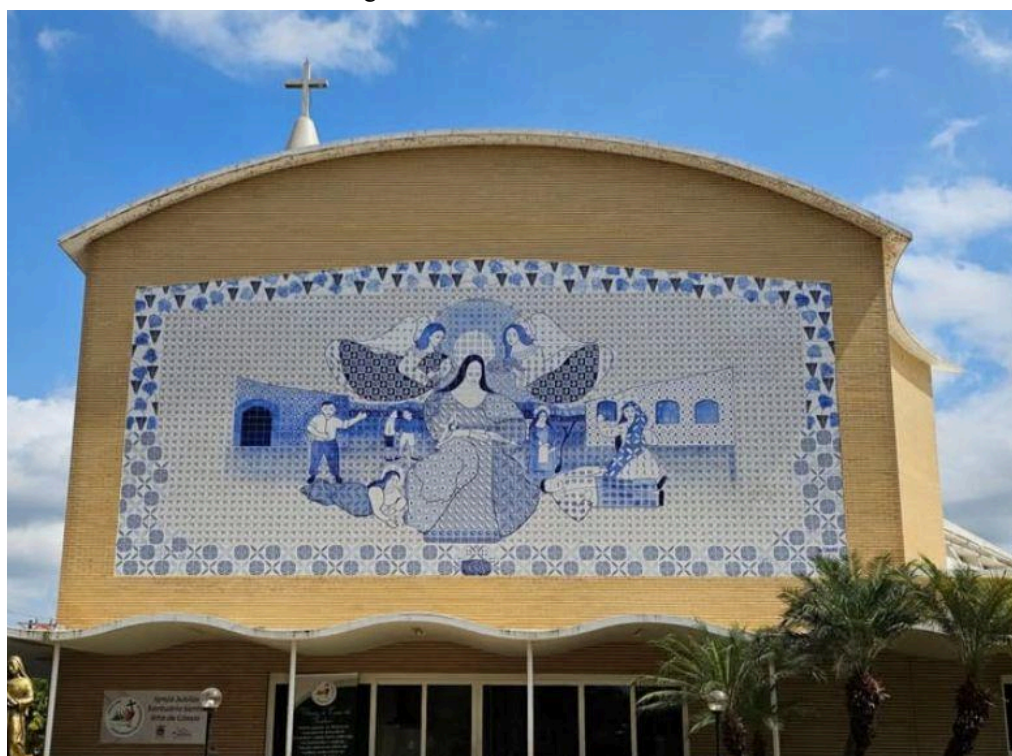
Figura 16 - A vida de Santa Rita

A partir dos anos 1950, a pintura de Djanira ficou mais dinâmica, a paleta diversificou com o uso de cores vibrantes, assim como a temática tornou-se mais variada, passando a representar as áreas rurais, as festas e os santos. É neste momento que a obra evoluiu graças à introdução de cenas de costume, os populares e as paisagens nacionais. Sua produção artística revela estreita conexão com a cultura de seu tempo e do meio que estava inserida, porém é singular e impregnada de uma visão própria da realidade (Naclério, 2017 p.06)