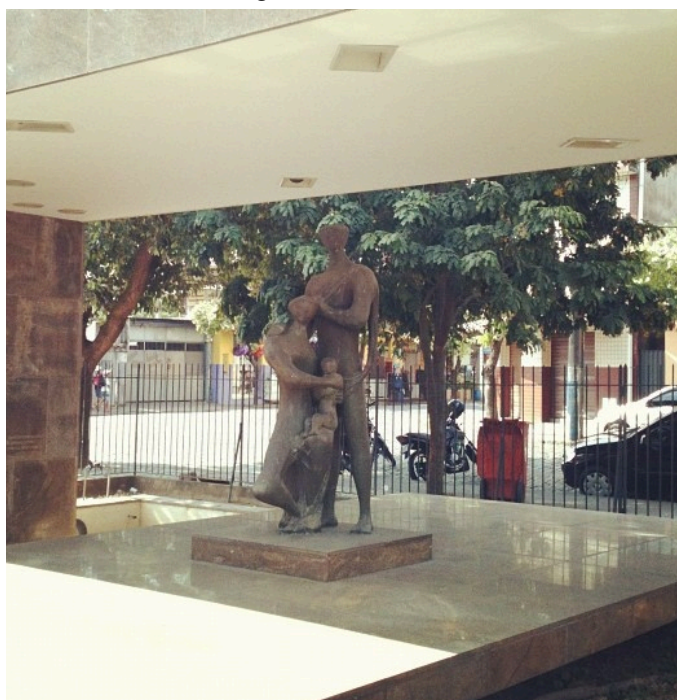
Figura 19 - A família