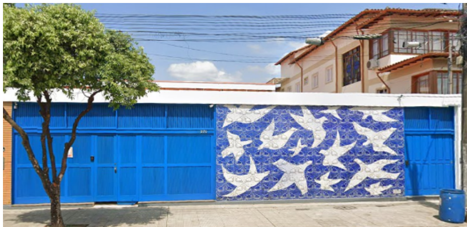
Figura 6 – Educandário Dom Silvério