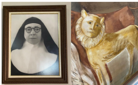
Figura 13 – Recorte da pintura: comparativo da Madre representado no leão.