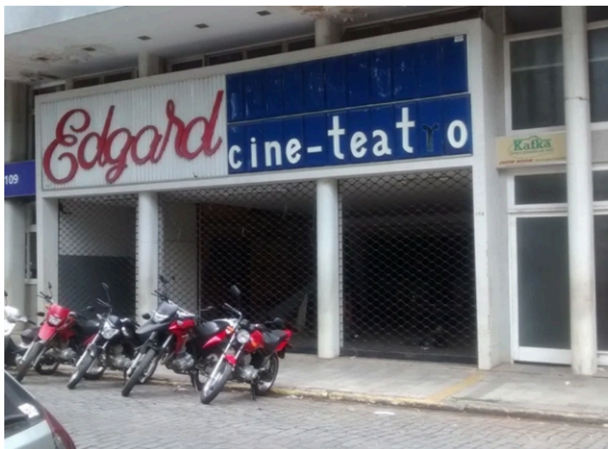
Figura 17 - Cine teatro Edgar