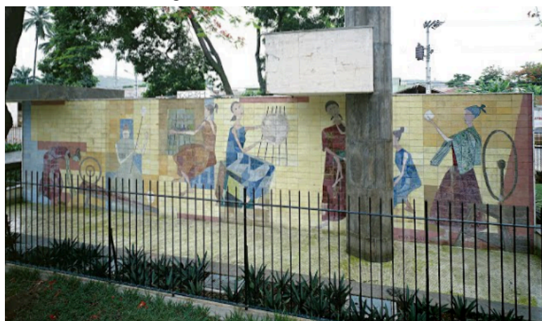
Figura 11 – Paineis as Fiandeiras