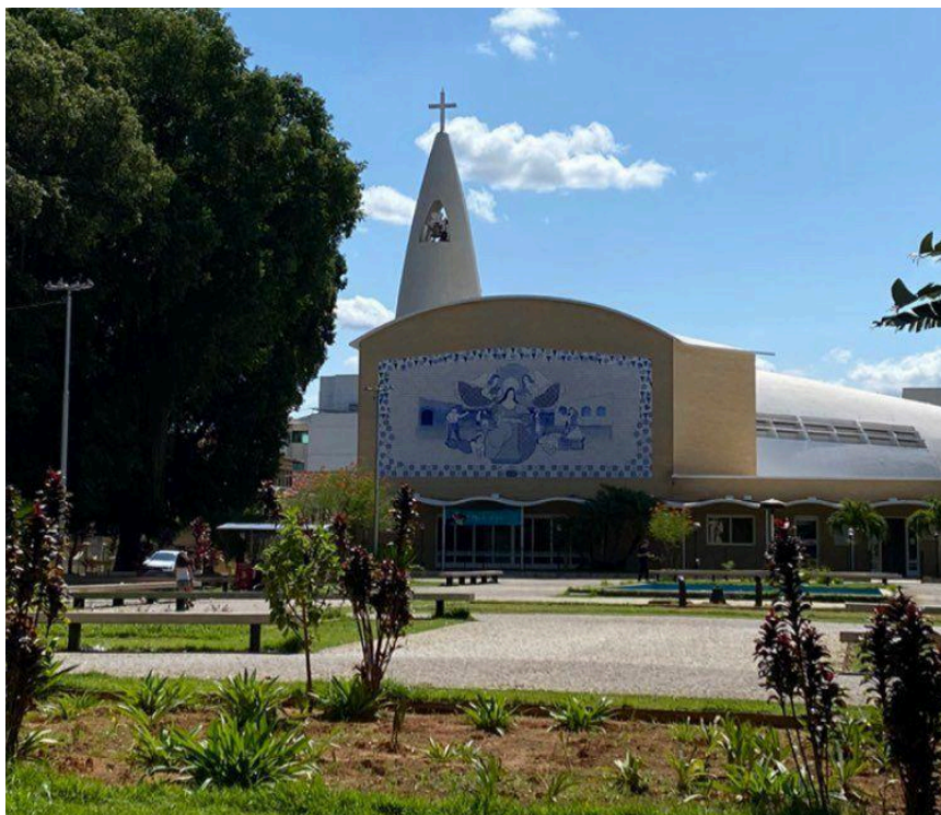
Figura 5 – Matriz Santa Rita de Cássia

A igreja Santa Rita de Cássia, padroeira da cidade, é uma das maiores dentre as principais igrejas localizadas na cidade, sendo autoria do arquiteto Edgar Guimarães do Vale. Seu caráter modernista se destaca por conta da ousadia das formas e curvas conjugadas com uso de concreto armado, que não era o esperado para uma igreja da época. Na sua fachada podemos notar em destaque o painel intitulado “A vida de Santa Rita” uma obra da pintora Djanira, também encontramos no interior outras obras instaladas no ano de 1996 representando a via sacra, tendo como autora Nanzita Salgado (Santos, 2019 p.20).