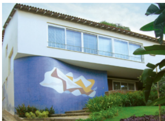
Figura 7 – Residência José Inácio Peixoto

O educandário Dom Silvério, construído por Francisco Bolonha, que tinha como objetivo acolher dezenas de meninas carentes, que recebeu, além da educação formal, de 1ª a quarta séries. Além disso, o prédio possui obras de artistas como Anísio Medeiros e Emeric Marcier. Desde 1994 o educandário possui um pequeno memorial carmelita da divina providência, onde reúne centenas de peças nos dias atuais e está aberto à visitação pública (Melo, 2016).