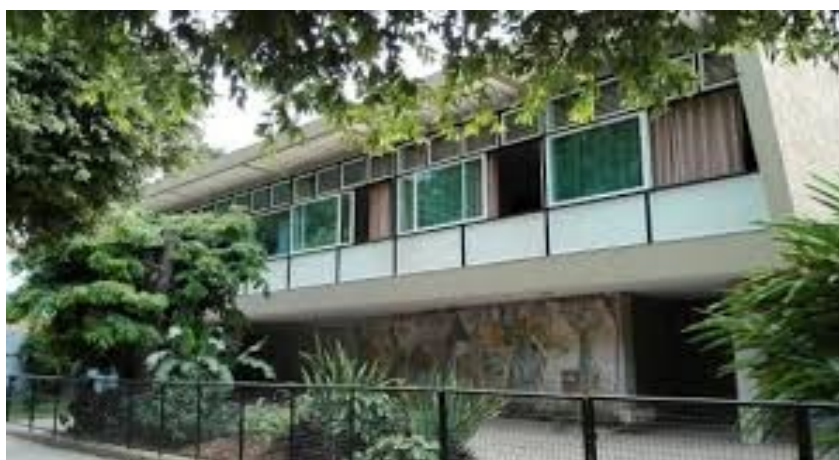
Figura 9 - Residência Nanzita