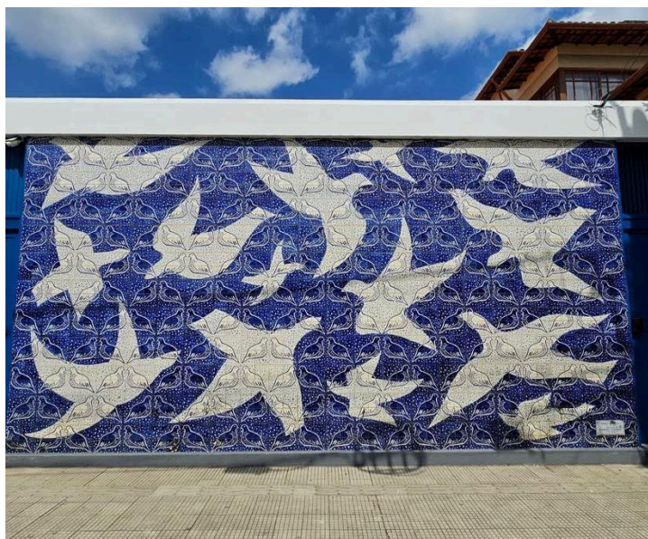
Figura 14- Os pássaros