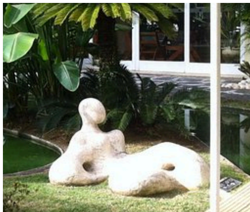
Figura 18- Mulher