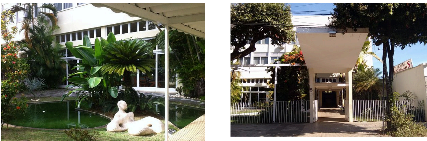
Figura 4 - Hotel Cataguases