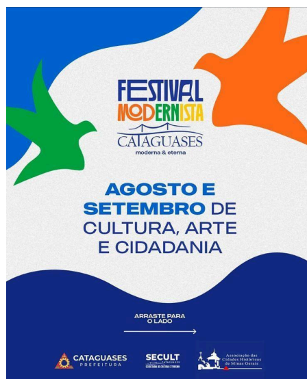
Figura 20 - Festival modernista de Cataguases

Além disso, Cataguases iniciou um novo programa no mês de agosto. O município gerou algumas atividades voltada ao setor turístico e cultural, trazendo um programa chamado festival modernista (Figura 19), onde foi realizado diversas atividades como palestras com nomes importantes da cultura mineira, feiras de livro, contação de história, roteiro gastronômico, lançamento de livros de autores cataguasenses, e outros. voltadas aos patrimônios culturais tombados, além disso também foi realizado visitas guiadas.