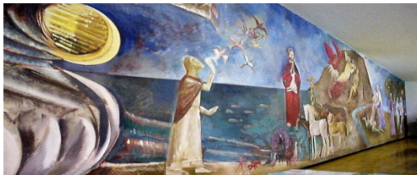
Figura 12 - A criação do mundo