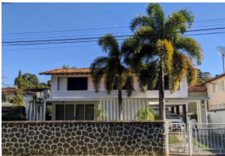
Figura 8 - Residência Altamiro Peixoto