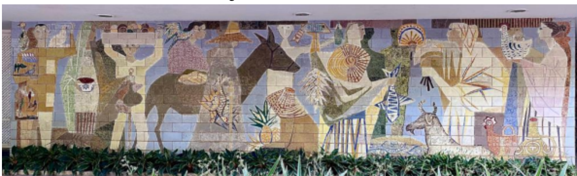
Figura 15 - Feira Nordestina

Outro painel é a “Feira Nordestina” de Anísio Medeiros, apresenta uma concepção figurativa de uma manifestação cultural nordestina, criado em formas apropriadas do cubismo. Duas personagens localizadas à esquerda do cenário posicionam-se de frente e parecem se comunicar diretamente com o observador perante a expressão de seus olhares, diferente das demais personagens que têm seus perfis traçados e direcionados para a esquerda e outras para a direita como se estivessem indo de encontro (Rodrigues, 2023 p.100).