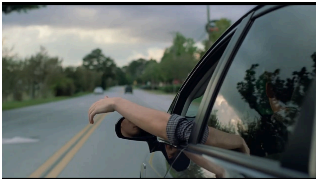
Figura 5: Última cena do filme. Jared filmado de costas, vestindo roupa escura.

Fonte: Boy Erased, direção de Joel Edgerton, 2018