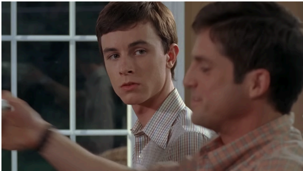
Figura 7: Cena do jantar. Bobby como espectador.

Fonte: Orações Para Bobby, direção de Russell Mulcahy, 2009