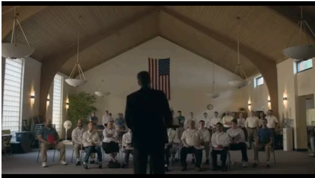
Figura 2: Pastor vestido de roupa preta e filmado em posição de superioridade.