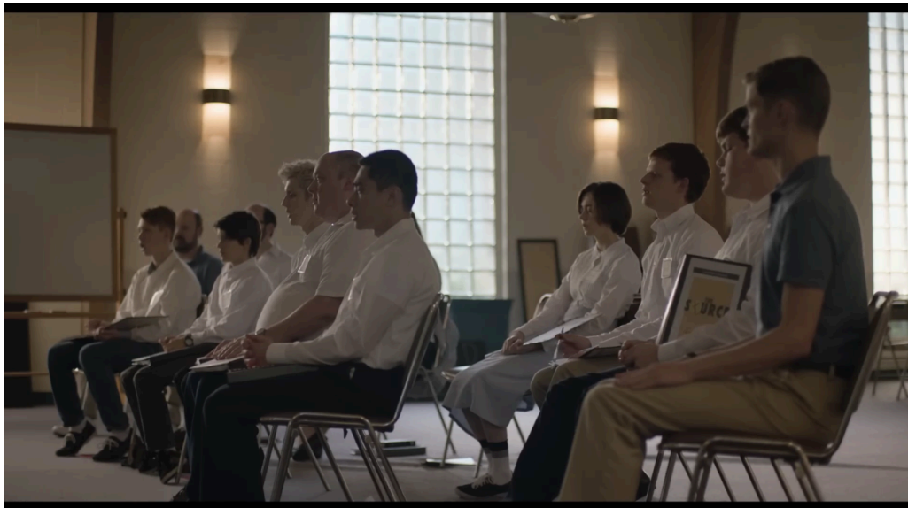
Figura 1: Personagens LGBTQIA+ vestidos de branco no programa de terapia de conversão.

Fonte: Boy Erased, direção de Joel Edgerton, 2018