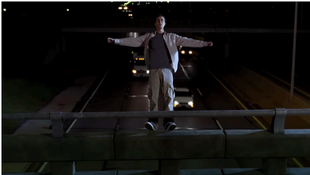
Figura 6: Cena do suicídio de Bobby.