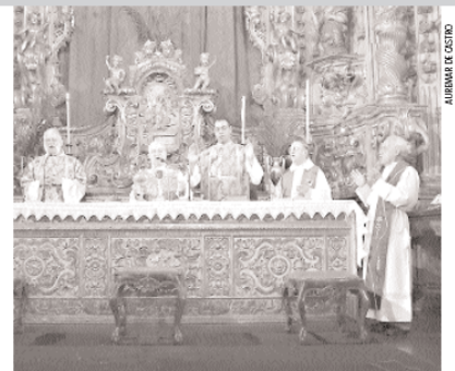
Matriz de Nossa Senhora do Pilar é um dos expoentes do barroco mineiro

Um dos objetivos da comemoração, segundo os organizadores, é o fortalecimento da educação patrimonial e das manifestações populares de Ouro Preto. Para abrir o cortejo do Triunfo, estará presente a Cavallhada, do distrito de Amarantina, numa representação da luta entre cristãos e mouros.