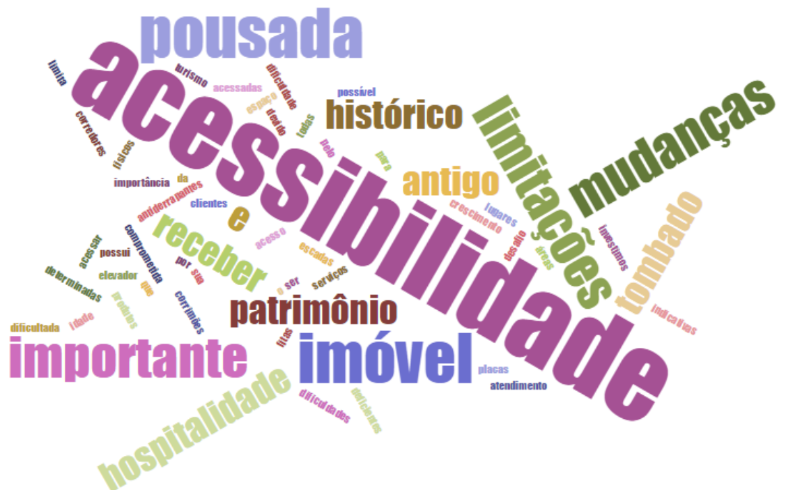
Figura 3 - Nuvem de palavras

A partir dos fragmentos das entrevistas foi possível elaborar a seguinte nuvem de palavras para delinear as representações sociais: