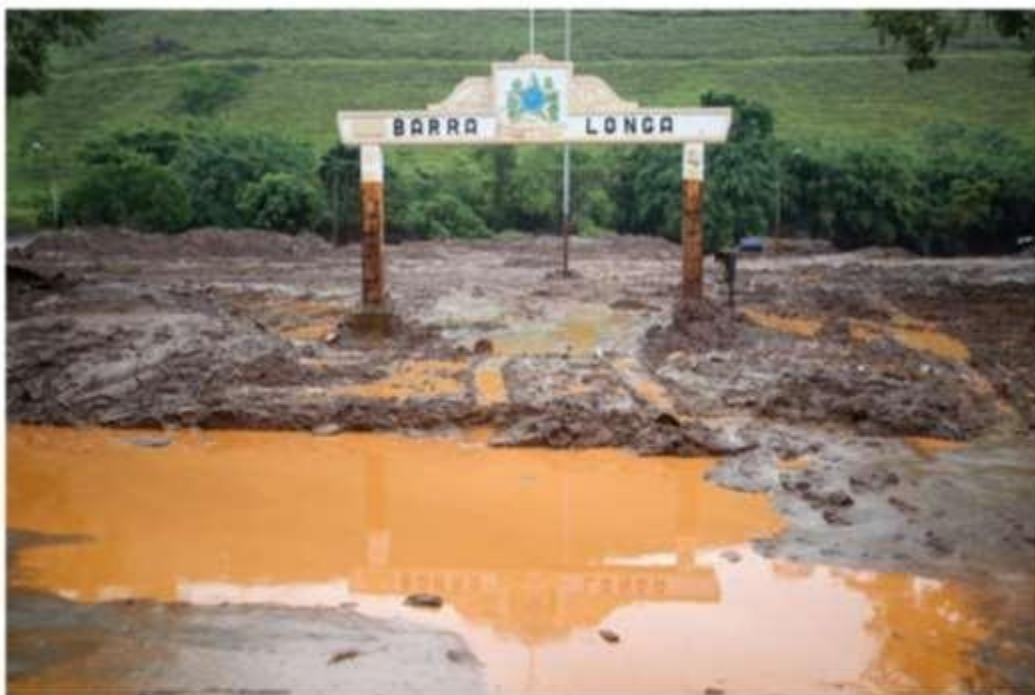
Figura 14 Praça Manoel Lino Mol, principal espaço público de Barra Longa /MG