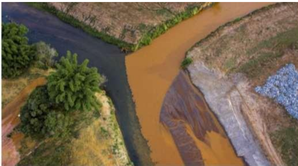
Figura 15 Encontro do Rio Gualaxo do Norte e Carmo- Barra Longa /MG