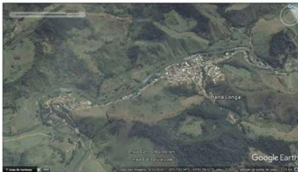
Figura 2 - Vista aérea de Barra Longa antes do desastre