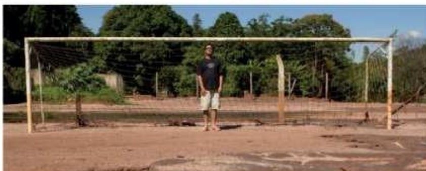
Figura 05