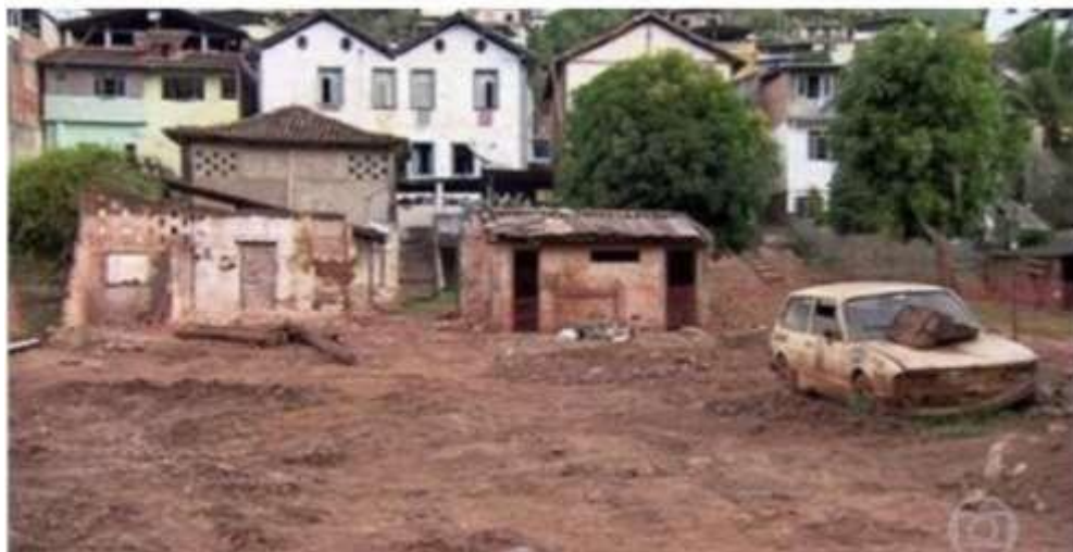
Figura 16 Casas destruídas na cidade de Barra Longa/MG.