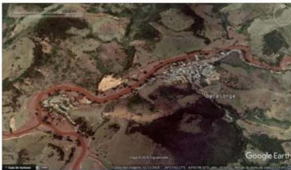
Figura 3 - Vista aérea de Barra Longa logo seguida ao desastre