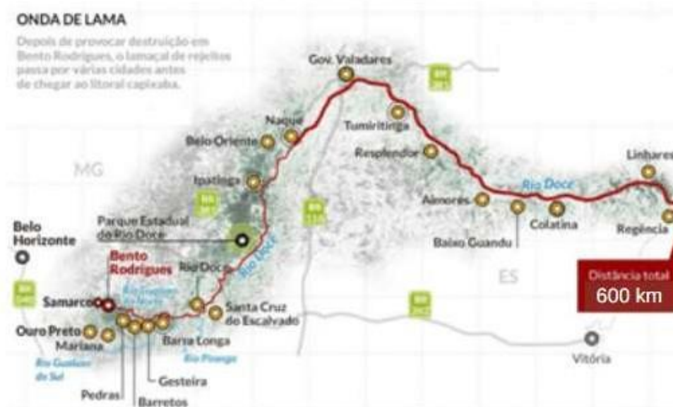
Figura 1 - O caminho da lama