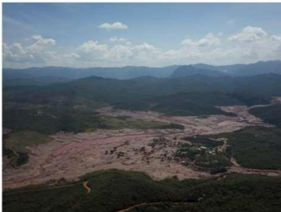
Figura 12 Área impactada imediatamente a jusante da barragem de Santarém.