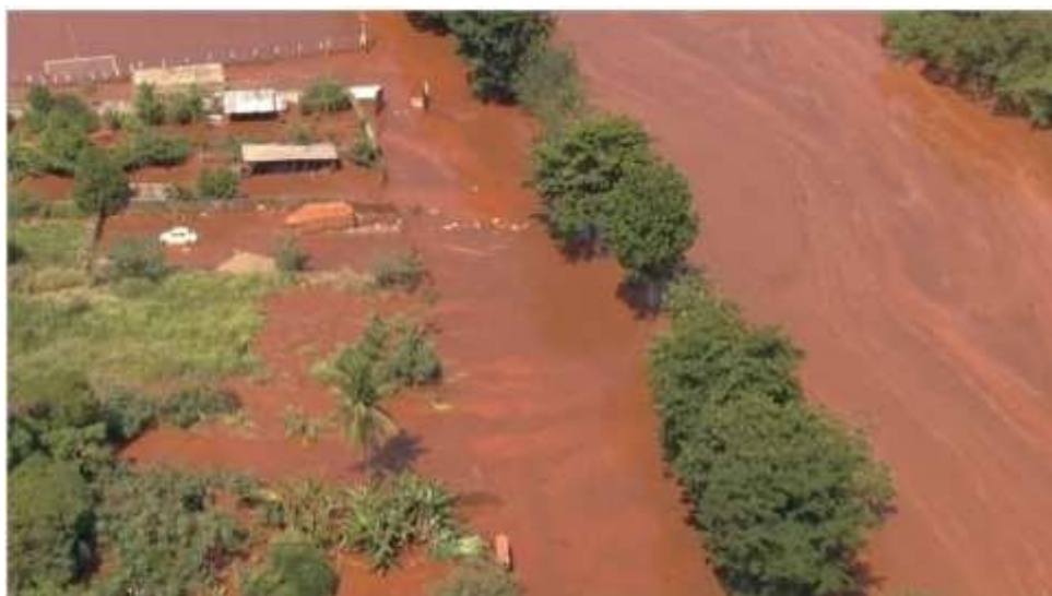
Figura 13 Praça Manoel Lino Mol, principal espaço público de Barra Longa /MG