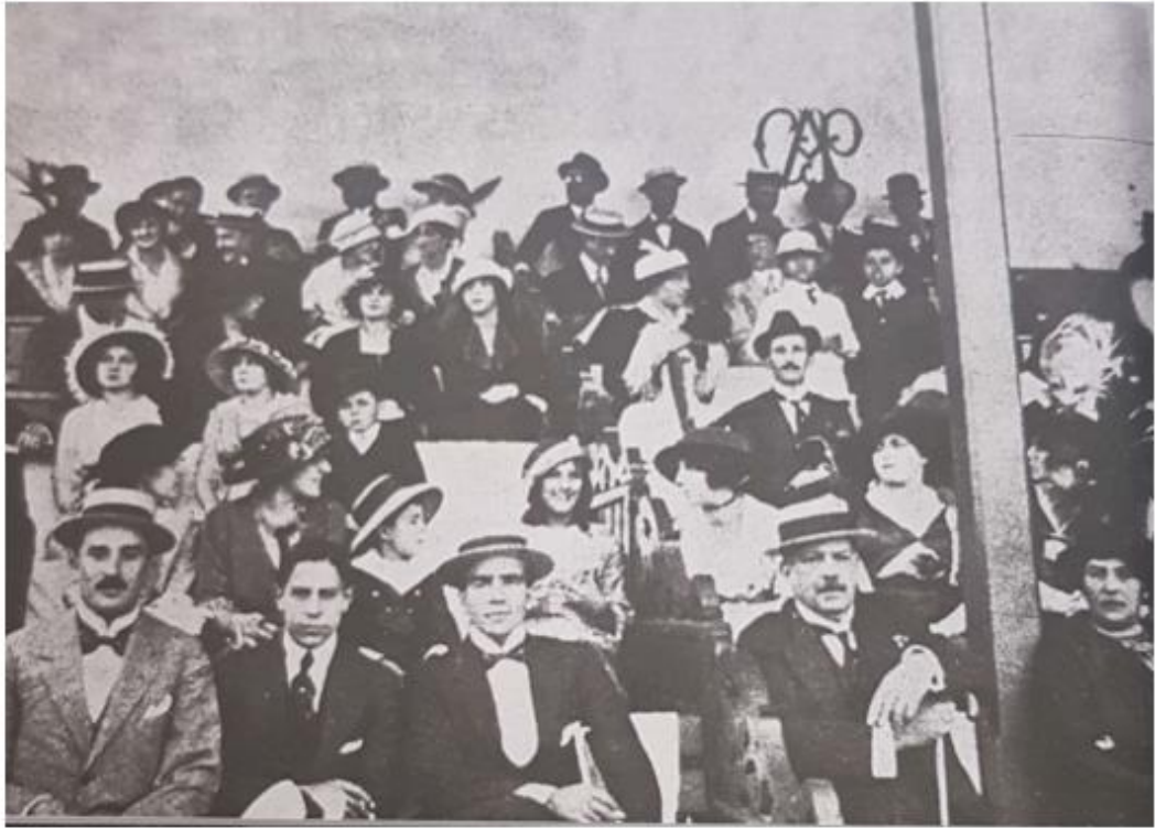
Figura 2. Torcedoras elegantes no Velódromo, em 1914.