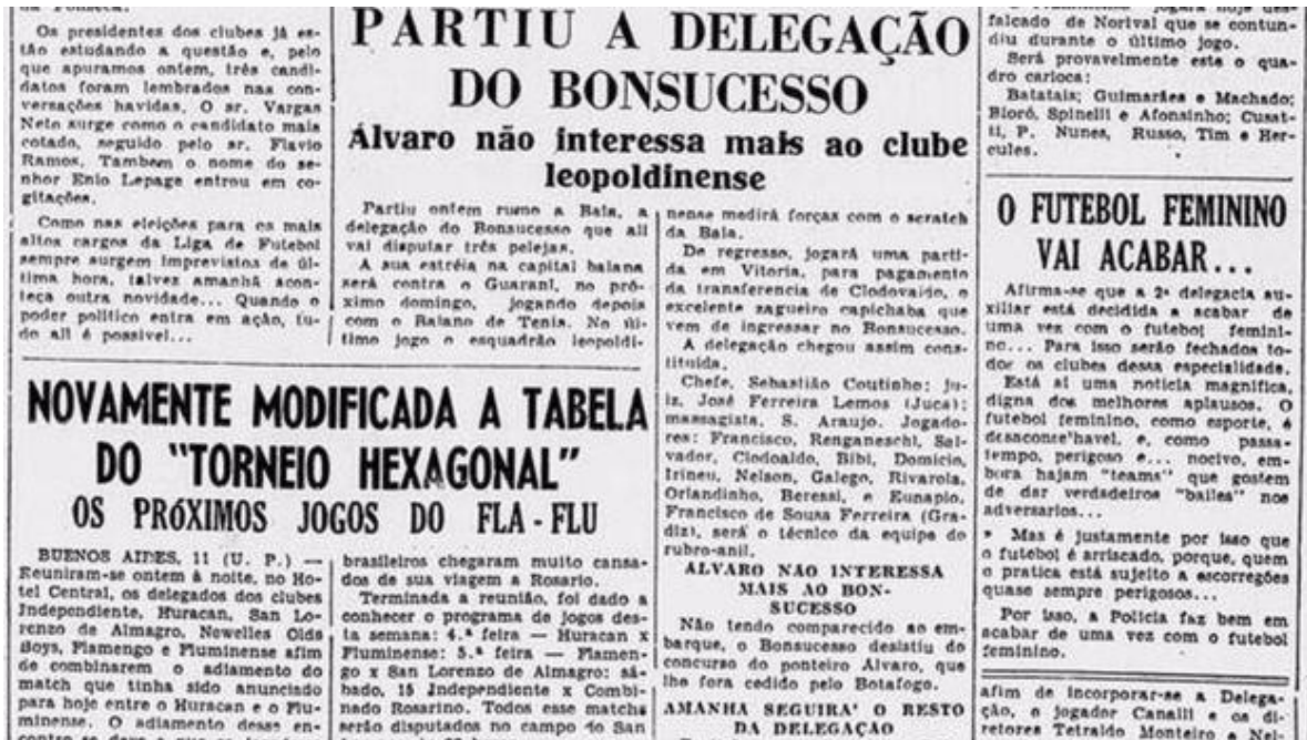
Figura 1: Notícia de jornal que falava sobre o futebol feminino.